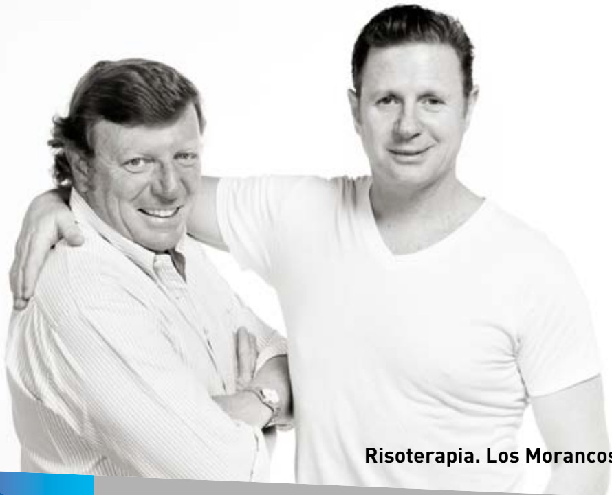
Risoterapia. Los Morancos